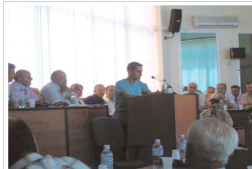
Avoneti, përbëhet nga katër OJQ të Ferizajit: "Qendra Avokuese për Progres", "Handikos", "Ardhmëria Rinore" dhe "Etika", është themeluar në vitin 2002.