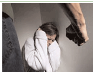
OKB-ja po bën hulumtim mbarë botëror për dhunën ndaj femrave, përfshirë Kosovën

Pas luftës, Qendra për Mbrojtjen e Grave dhe Fëmijëve ndihmoi 1,960 viktimat të dhunuara të luftës, përfshirë 29 femra të moshës së re, të cilat u ndihmuan të abortojnë shtatzënësi të dhunshme të luftës. Femrat kosovare në shoqërinë civile me sukses kanë formuar dhe drejtuar pesë shtëpi të sigurta në rajone të ndryshme të Kosovës. Fushata e Rrjetit të Grave të Kosovës kundër Dhunës ndaj Femrave