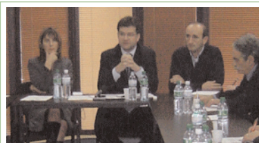
Tryezë të rrumbullakët me përfaqësues të OJQ-ve të Kosovës dhe Miroslav Lajçak në ATRC

Drejtor i Përgjithshëm për Çështje Politike në Ministrinë e Punëve të Jashtme të Sllovakisë theksoi rolin e rëndësi-