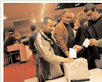
Votimi në AGPK

Asociacioni i Gazetarëve Profesionistë, i themeluar më