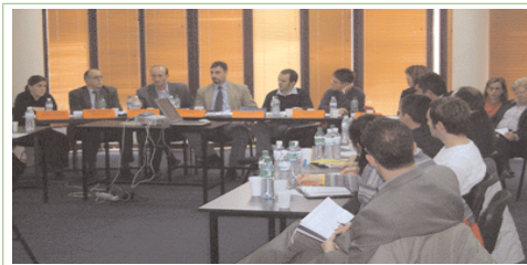
Pjesëmarrësit debatojnë korrupsionin në Kosovë

lin e shoqërisë civile në luftimin e korrupsionit. Znj. Hall theksoi se kredibiliteti dhe legjitimiteti janë qenësore për