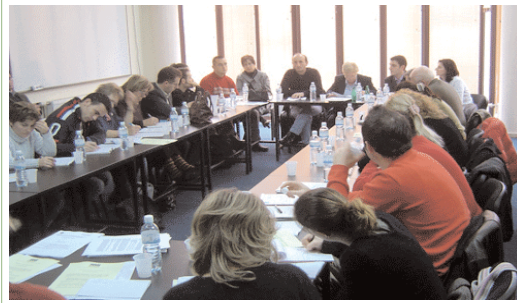
Takim informativ i ATRC, IREX dhe FDI në Prishtinë

Si organizatë që ju shërben të tjerëve, programet e ATRC-së janë të dizajnuara t'i plotësojnë nevojat aktuale dhe ato në zhvillim e sipër të OJQ-ve. Shërbimet tona përfshijnë trajnime dhe konsul-