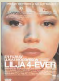
Filmi "Lilja 4-Ever" i regjisorit Lukas Moodysson

Ky grup punues është pjesë e projektit të IOM-it "Së bashku kundër trafikimit të njerëzve".