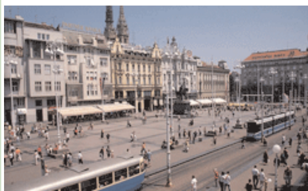
Zagreb, Kryeqyteti i Kroacisë

Parlamenti kroat miratoi Ligjin për Fondacionin Kombëtar për Zhvillim të Shoqërisë Civile më 15 tetor, 2003. Miratimi i Ligjit shënon hap kritik përpara në zhvillimin e shoqërisë civile dhe në qëndrueshmërinë financiare të OJQ-ve në Kroaci. Fondacioni Kombëtar kroat për Zhvillimin e Shoqërisë Civile, konsiderohet njëri ndër shembujt më novativ të partneritetit OJQ/qeveri në rajonin e Evropës Qendrore dhe Lindore. Sipas Ligjit, fondacioni është themeluar ligj publik, misioni i të cilit është të shërbejë dhe zhvillojë shoqërinë civile në Kroaci. Fondacioni përkrah programe novative të zhvilluara nga OJQ-të dhe iniciativa joformale, të bazuara në komunitete.