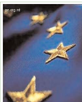
Një seancë informimi për kërkesën për projekt propozime do të mbahet më 12 shtator, 2006 në orën 10:30 në zyrat e Agjencionit Evropian për Rindërtim, Prishtinë

shoqërisë civile për të kontribuar në mënyrë të efektshme në transformimin dhe zhvillimin e strukturave ekonomike dhe qeverisëse duke afruar të gjitha komunitetet e Kosovës më