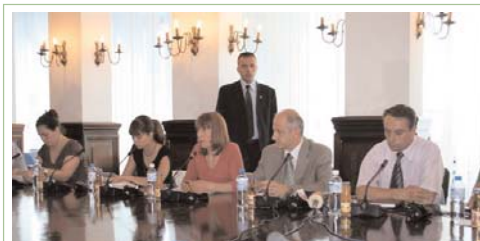
Tryeza e rrumbullakët ndërmjet Kryetarit të Kosovës Fatmir Sejdiu dhe përfaqësuesve të shoqërisë civile më 18 korrik

"Mos u bëni pjesë e ndonjë lobimi politik ose instrument i ndonjë partie politike sepse mund ta