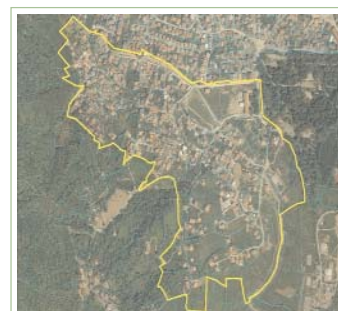
Lokacioni Zatra në Komunën e Pejës, Kosovë

Syri i Vizionit do të vazhdoj të punoj në identifikimin e vendbanimeve joformale në bashkëpunim me grupet e komunitetit me qëllim të përfshirjes së tyre në planin e zhvillimit urbanistik të Pejës.