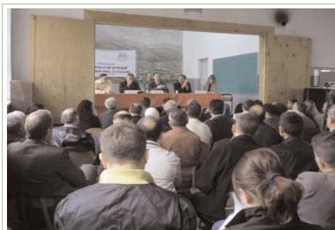
Shtatë qind e tridhjetë qytetarë kanë marrë pjesë në 12 takime publike në mbarë Kosovën në shtator dhe tetor për tu informuar për statusin

Qytetarë, përfaqësues të qeverisë lokale dhe asaj qendrore, OJQ-ve, mediave dhe sektorit të biznesit në dymbëdhjetë qytete të Kosovës u është ofruar mundësia të informohen dhe të bëjnë pyetje për procesin e zgjidhjes së statusit, gjatë 12 takimeve publike të organizuara nga ATRC dhe Zyra Britanike në muajt shtator dhe tetor.