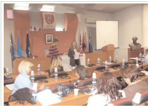
Tryeza e rrumbullakët e mbajtur në Pejë më 5 shtator

Tryezat kanë qenë diskutime të hapura për të gjithë pjesëmarrësit të cilët kanë