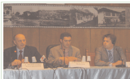
Kryeministri, Agim Çeku, u sqaroi më 22 maj qytetarëve të Prishtinës procesin e zgjidhjes së statusit të Kosovës

Përfaqësues të qeverisë lokale dhe asaj qendrore, OJQ-ve, mediave dhe sektorit të biznesit në pesë rajonet e Kosovës kanë pasur mundësi të informohen, shqetësimet e tyre të dëgjohen dhe të bëjnë pyetje për procesin e zgjidhjes së statusit të Kosovës, gjatë pesë takimeve publike të organizuara nga ATRC-ja në muajin maj.