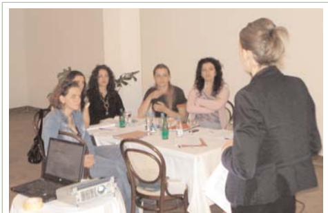
Sesion trajnimi në qytetin e Gjakovës më 31 maj

Rrjeti i Grave të komunitetit RAE është sektor tjetër i shoqërisë civile, të cilin ATRC-ja e ka përkrahur në ngritje të kapaciteteve organizative përmes trajnimeve për shkrim të projekt propozimeve, rolin e OJQ-ve në shoqërinë civile, monitorim dhe vlerësim, qe-